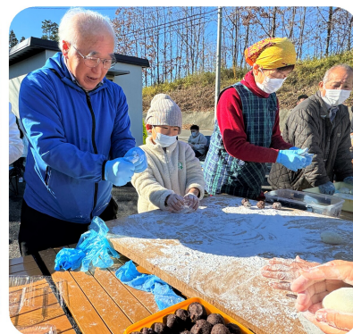
小学生も搗いたり丸めたりと、お手伝いをしてくれました。