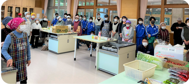
小中学生や地域団体の皆さん、約50名が参加。

80歳以上ひとり暮らしの方、90歳以上のご夫婦へ、「長寿のお祝い・見守り・ふれあい」を目的にお弁当をお配りしています。お弁当も人も、温かい『ふれあい』ができました。