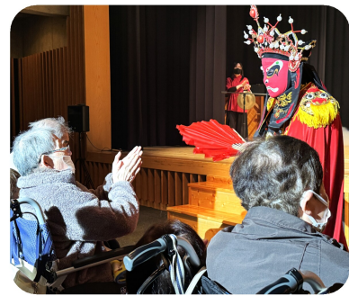
Mr.シュガー（親子3人）の変面ショー。お面が変わる度に歓声があがりました。