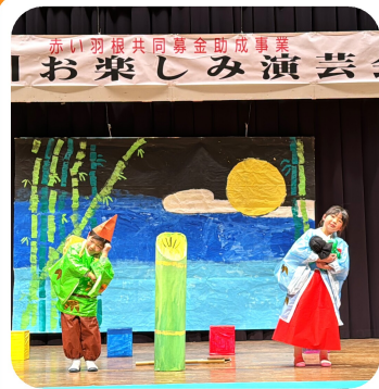
しいのみこども園によるオペレッタ（歌と踊りの音楽劇）『竹取物語』。