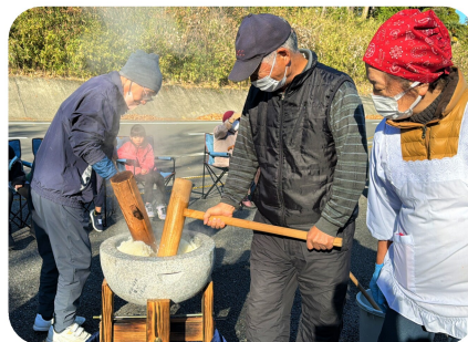
蒸す→捏ねる→搗く→丸めるまで、委員さん頑張りました。

12月24日、民生児童委員さんの企画で、ももたろう『子ども&シルバー食堂』餅つき交流会が行われました。食堂参加者が一緒になって餅作りに参加される様子や、搗き立て餅を美味しそうに頬張る子どもさんの姿などが、とてもほほえましかったです。「またどこかで餅つきやりたいね♪」と、民生児童委員さんから次回開催の声が挙がっていました。