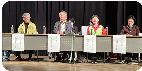
発表者の皆さん。 写真や動画で、 分かりやすく 紹介していただき ました。

★ 合川支え愛会(合川地区) …月3回の寄り合い場(ミニデイ、カフェ)。若者もスタッフで参加。