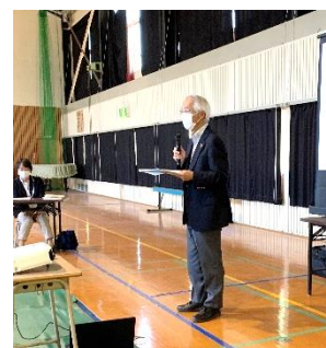
津留自治会の活動報告