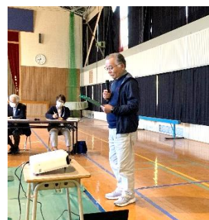
中原自治会の活動報告