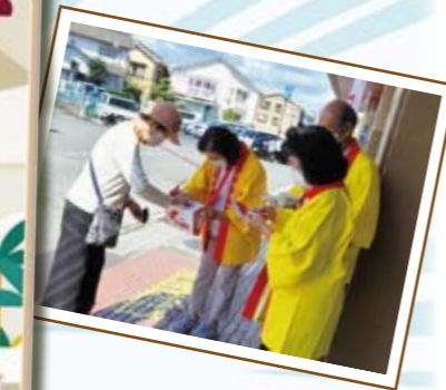
(昨年の街頭募金の様子)