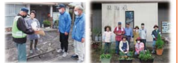
支え合いまちづくり事業

コロナ禍でのボランティア活動は難しいが、独り暮らし高齢者世帯に声かけを行いました。最近、近所でも話をする機会が少なくなったので、皆さんに喜んでもらえました。そして、朝地駅の清掃、花の手入れをすることができ、朝地駅利用者や立ち寄った方から「とても綺麗で心が和む」との声をいただきました。これからの支え合いの町づくりに少しですが、つなげていく事ができました。ありがとうございました。