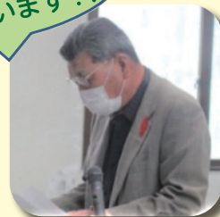
豊後大野市老人クラブ連合会