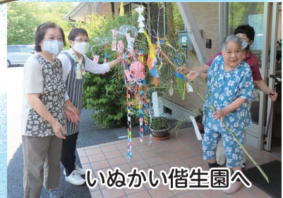
いぬかい偕生園へ