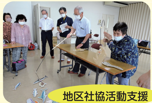
地区社協活動支援