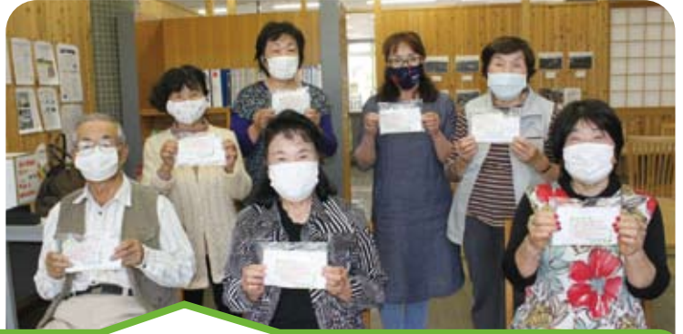
【千歳地区社協・千歳町ボラ連と町の有志の皆さん】