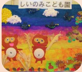
作品はユニークで見応えたっぷりでした