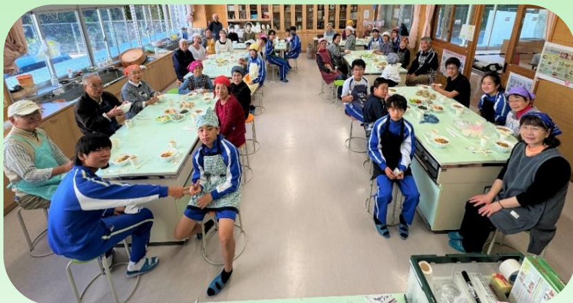
地区社協・清川小中学校・民生児童委員・福祉委員・老人クラブ・サロンなど、総勢50名にご参加いただきました。

町内80歳以上ひとり暮らしの方などを対象に、「長寿のお祝い・見守り・ふれあい」を目的とした取り組みです。今年も3年ぶりにお弁当作りができました。清川小中学生の皆さんにもお手伝いいただき、皆さんのお弁当を作りました。100食分のお弁当を作りました。子ども達が書いたメッセージを添え、民生委員さんや福祉委員さんが一軒ずつお弁当を配達。お弁当も人も、とても温かい『ふれあい』ができました。