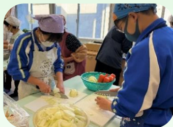
6つの班に分かれ、食材切りから調理、盛り付けまで、みんなで協力して作りました。昼食のまかないカレーは絶品でした♪