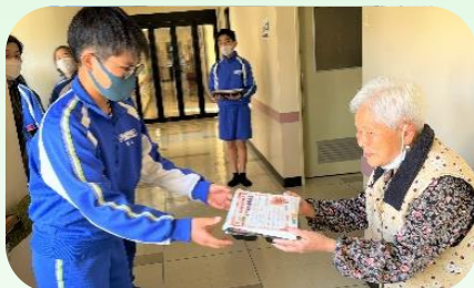
中学生も直接お弁当をお渡しました(徒歩で行ける場所)。