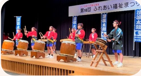
清川中清流太鼓でステージ開幕

晴天のもと4年ぶりの開催。ステージでは清川中の清流太鼓や舞踊、神楽など7団体が出演、ロビーでは市内13福祉施設等の作品展、屋外では地域ボランティア等による模擬店が出店され、町内外より約300人が来場されました。準備から片付けまで、区長さん、民生児童委員さん、福祉委員さん等にもご協力いただきました。清川町民で作り・集い・楽しむ、4年ぶりの『ふれあい』の場は、あふれる笑顔で賑わっていました。