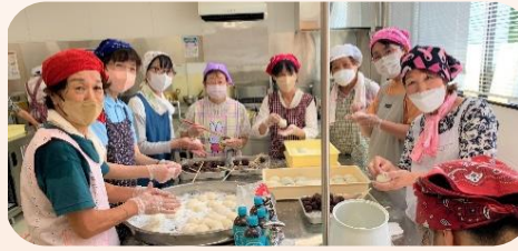
搗き餅など、模擬店は全て完売でした♪